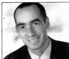
MATURASCHULE DR. ROLAND

Die gleichen Möglichkeiten wie mit einer Vollmatura, aber nur 4 Prüfungen (Englisch, Mathematik, Deutsch, Fachbereich) – die Berufsreifeprüfung (BRP) ist eine interessante Alternative zu den üblichen Wegen Richtung Universität. Einzigartig bei Dr. Roland: Wer die BRP nicht in der vorgesehenen Zeit